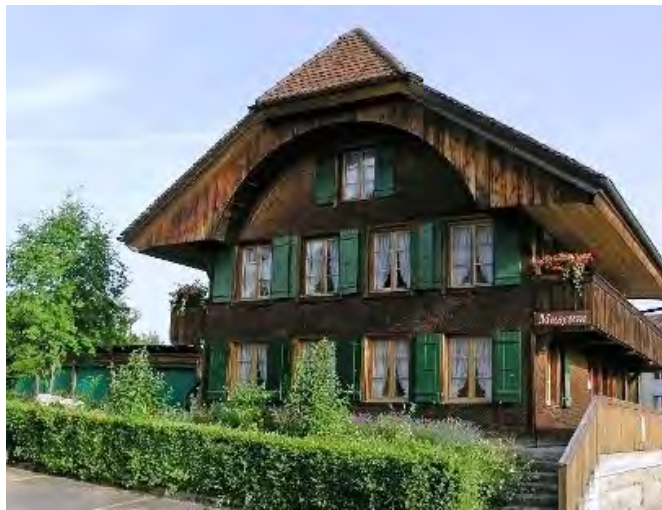
Regionalmuseum Schwarzwasser in Schwarzenburg.

Ein guter Grund für gemeinsame Projekte: In Schwarzenburg sind, wie schon letztes Jahr, mehrere Objekte aus der Sammlung des Sensler Museums ausgestellt. Die beiden Institutionen treffen sich in der «Mitte» in Burgbühl für eine Abendveranstaltung in Form