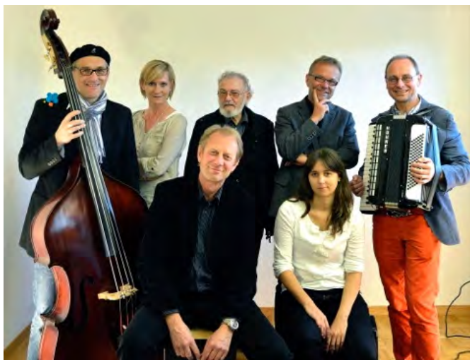
Die Band Düchoix mit den Dichterinnen und Dichtern.

Wie mag Musik tönen, wenn lyrisch-rhythmische Musik auf eine charakteristische Sprache trifft? Seit Jahren unternimmt die Formation Düchoix den Versuch, das archaisch wirkende Senslerdeutsch mit sensiblen und rhythmischen Klängen zu einer