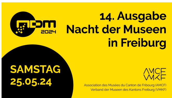
Der Verband der Museen des Kantons organisiert den Abend.

Gleich zwei kleine Vernissagen erwarten Sie in Tafers: Ein Parcours präsentiert das Ergebnis