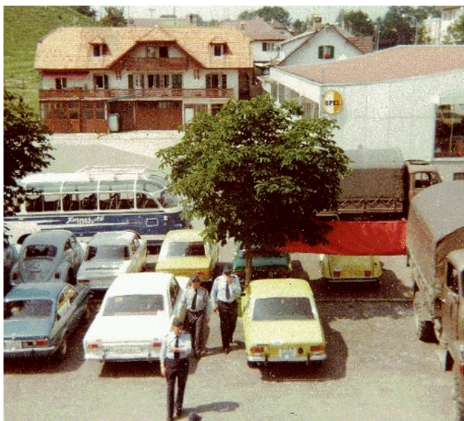
Alter Parkplatz neben dem Hotel Taverna. Hier war auch einer der Knotenpunkte für die Postkutschenlinien. Archiv Sensler Museum/1970er